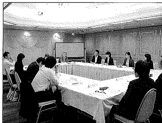
(グループ討議の様子)