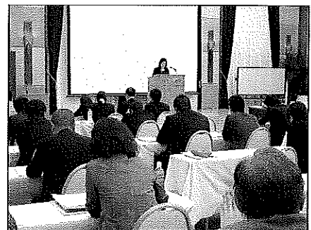
(グループ報告会の様子)