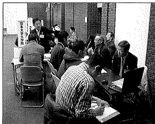
(通信制大学院合同入学説明会の様子 12月2日)