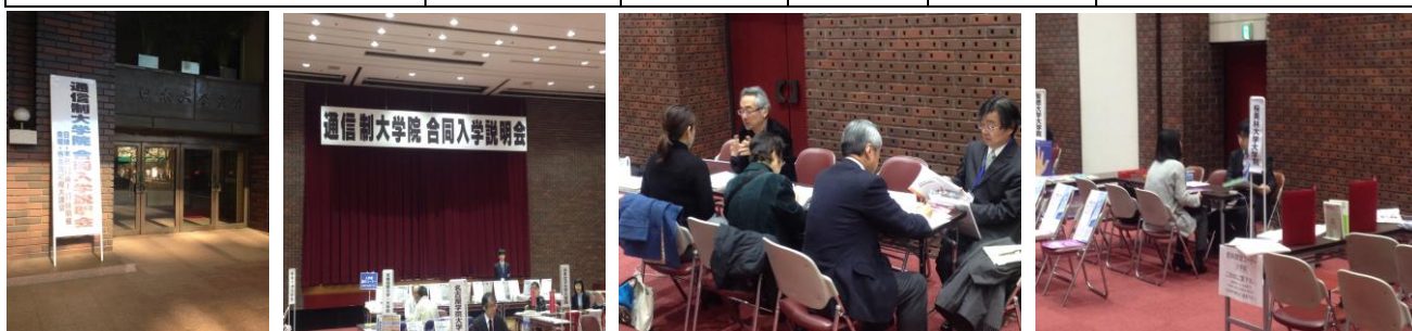
(通信制大学院合同入学説明会の様子 12月5日)