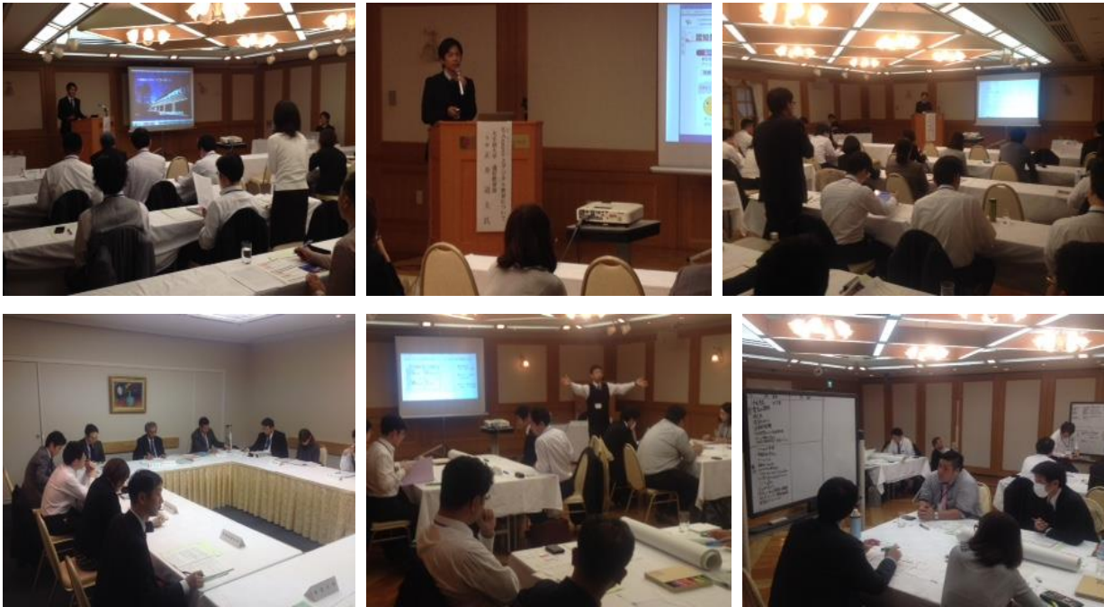
(大学通信教育中堅職員研修会の様子 12月11日)