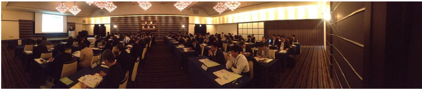
(講演を視聴する参加者の様子)