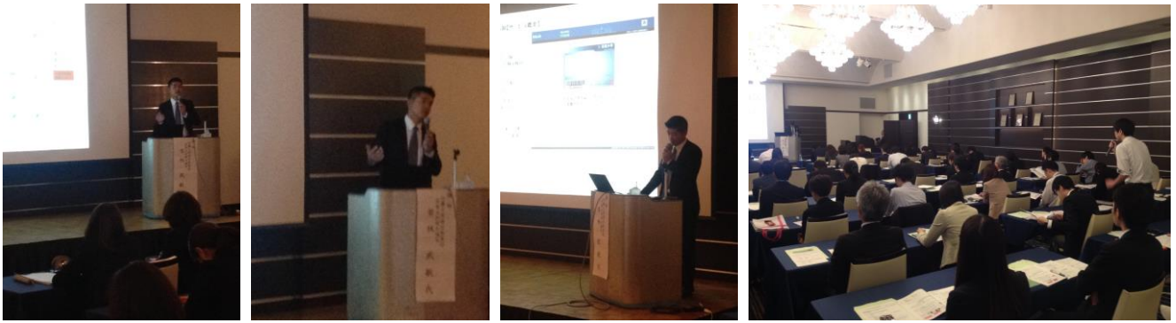
(若林氏による講演の様子)