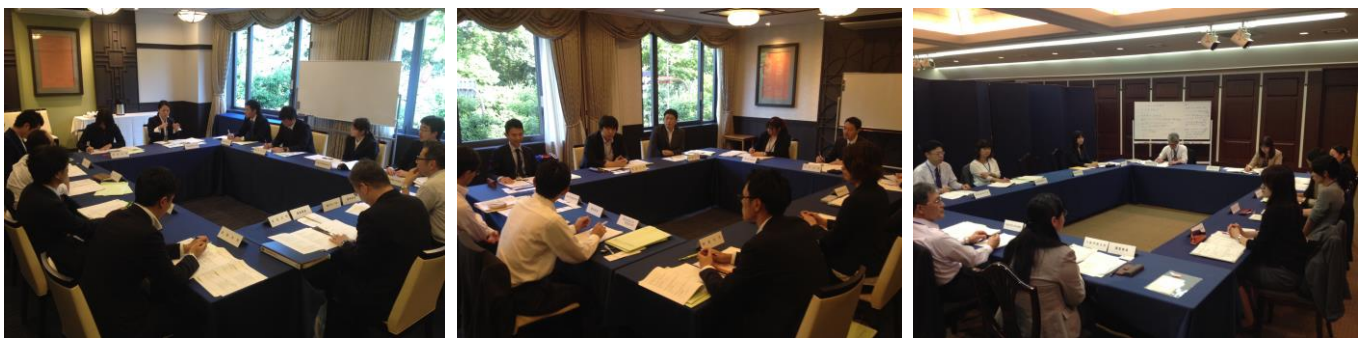
(グループ討議の様子)