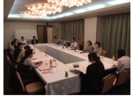
(グループ討議の様子)