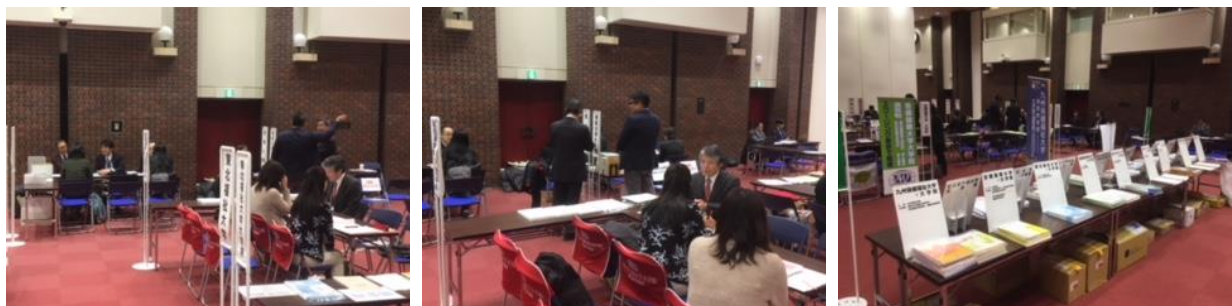
(通信制大学院合同入学説明会の様子 12月16日)