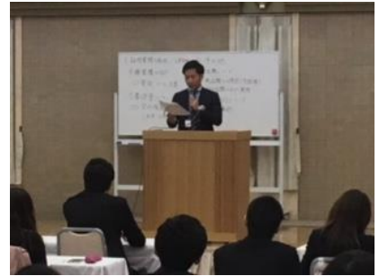
(全体会での報告の様子)